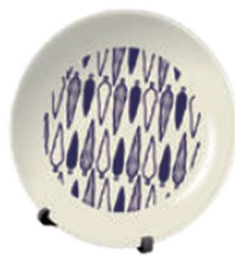
有田焼小皿(スタンド付)